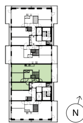
3 e t/m 8 e verdieping